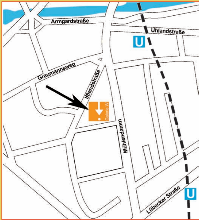
Der Weg zur Galerie-W mit der U-Bahn: Lübecker Straße und Uhlandstraße