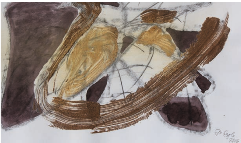
Averser, Mixed Media, 50 cm x 70 cm, 2016