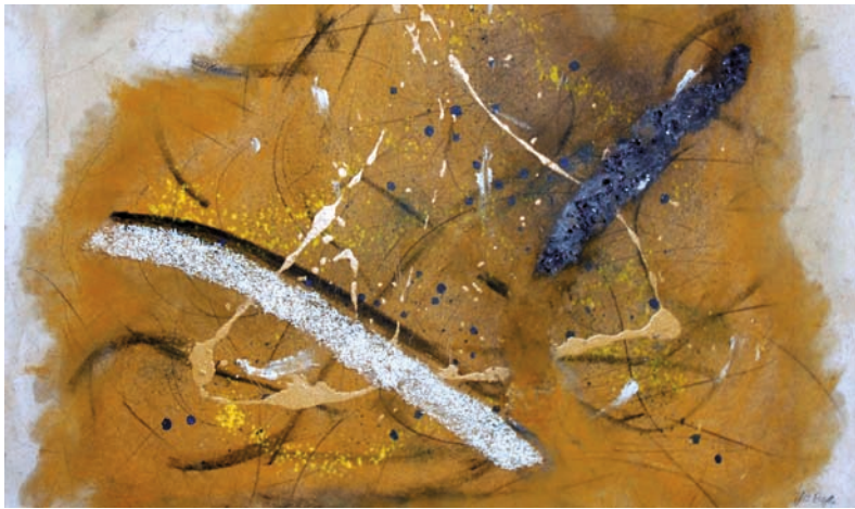
Leben I, Mixed Media, 2008, 100 cm x 200 cm