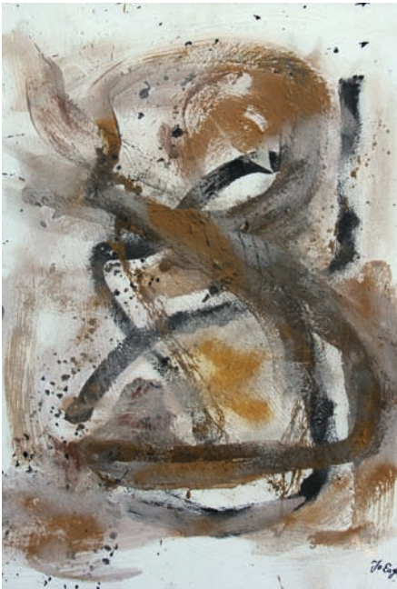
Ursus, Mixed Media, 80 cm x 100 cm, 2017