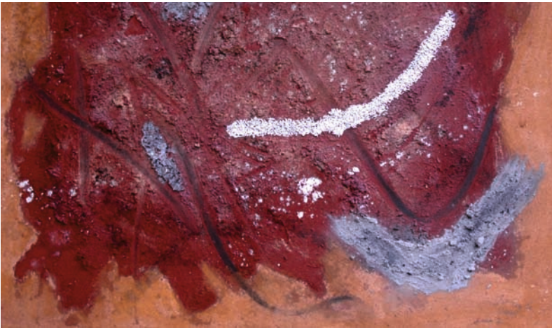
Leben II, Mixed Media, 2008, 100 cm x 200 cm