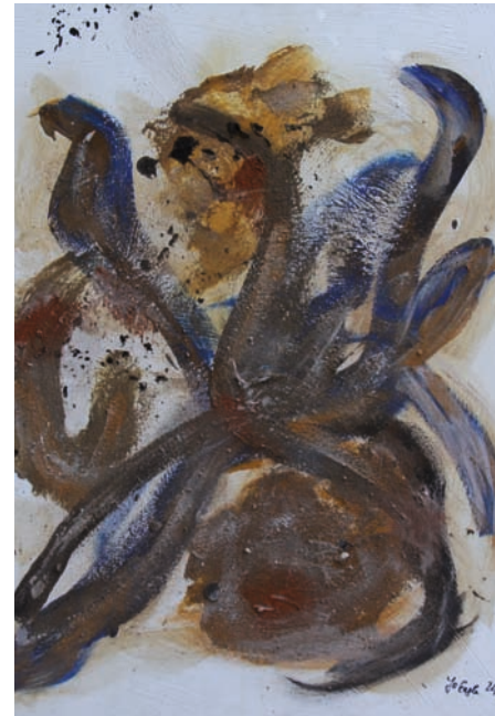
Gallus, Mixed Media, 80 cm x 100 cm, 2017