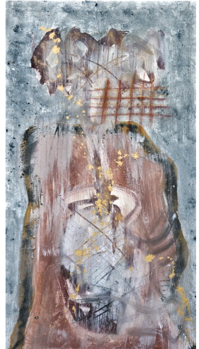
Heiliger Berg, „TAI SHAN“, Mixed Media, 130 cm x 80 cm, 2017